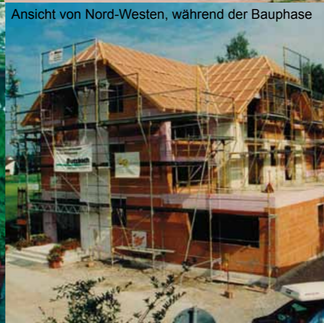
Ansicht von Nord-Westen, während der Bauphase