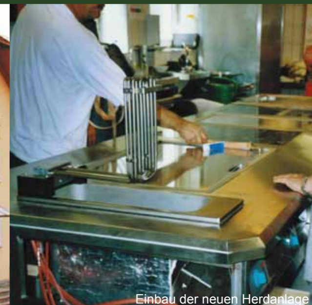
Einbau der neuen Herdanlage