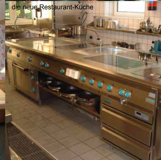
die neue Restaurant-Küche