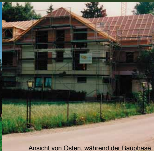
Ansicht von Osten, während der Bauphase