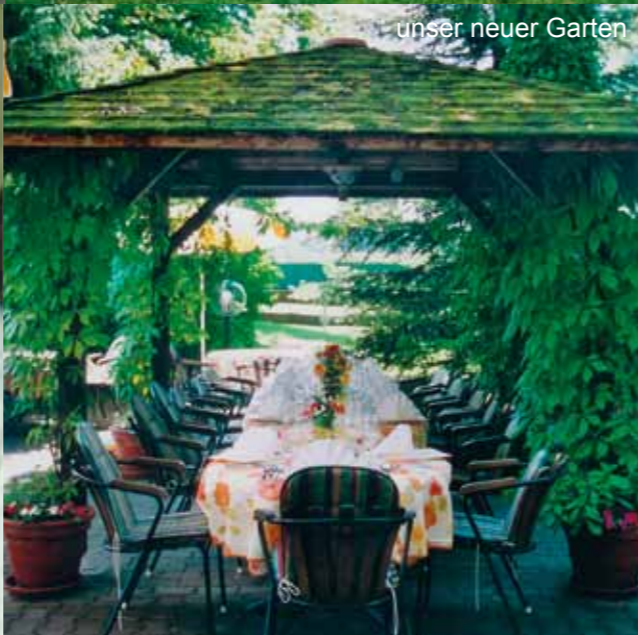
unser neuer Garten